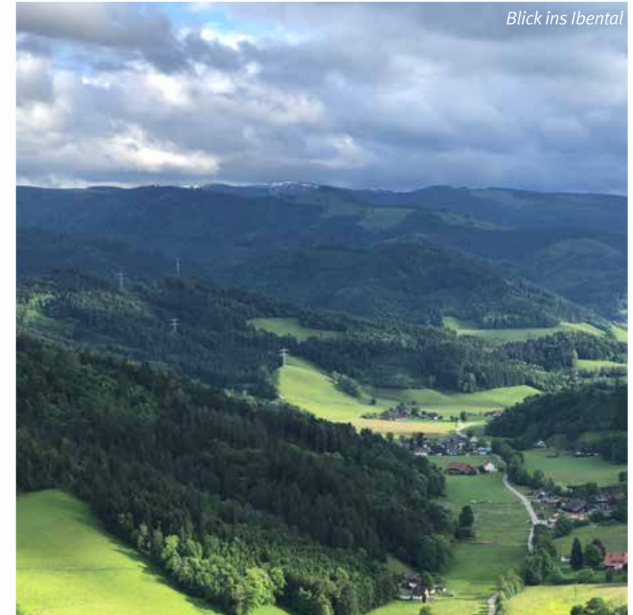
Blick ins Ibental