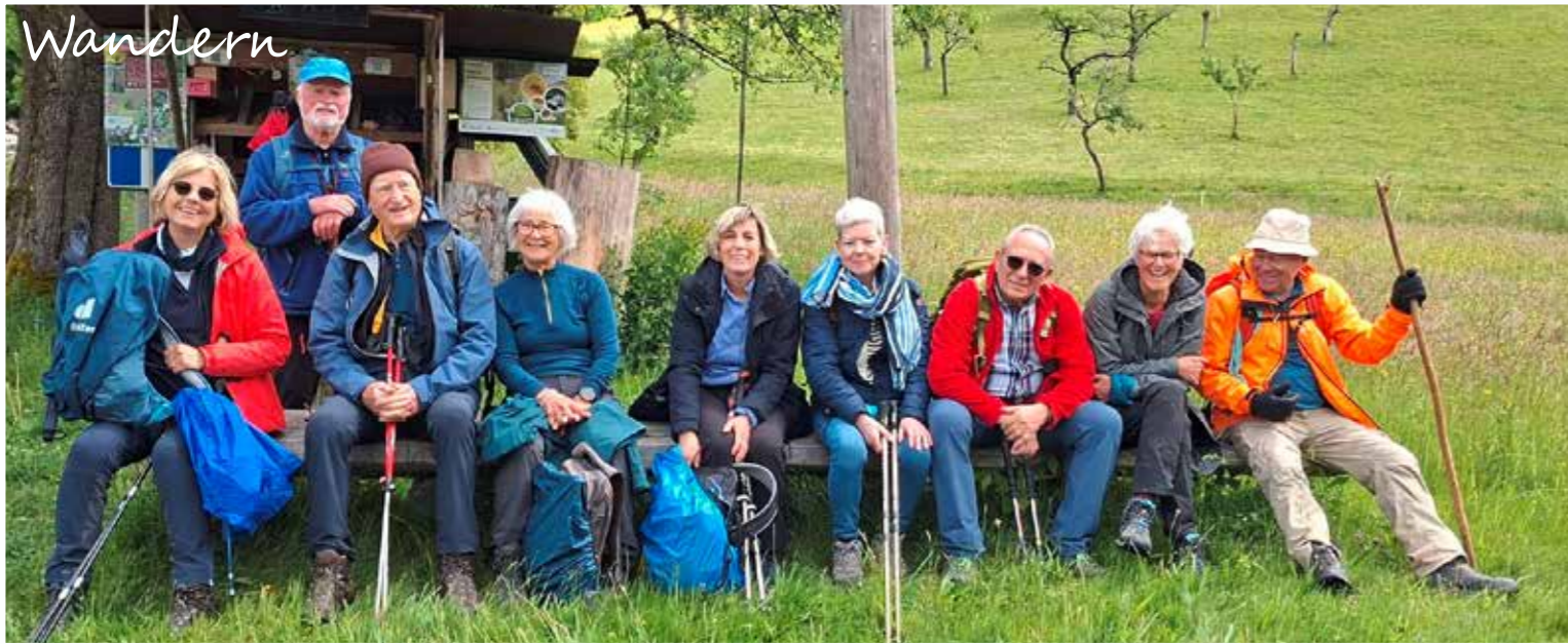
Auf dem Weg nach Oberried