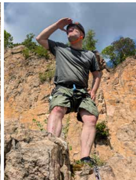
Wo bleibt der Regen?