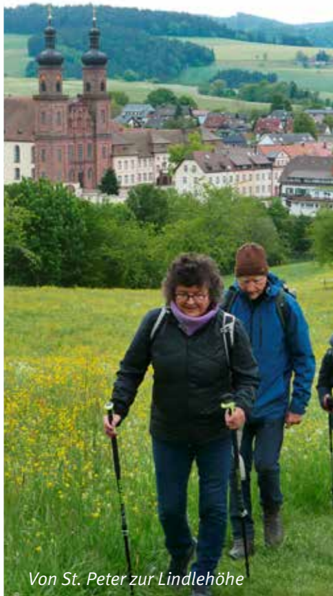
Von St. Peter zur Lindlehöhe