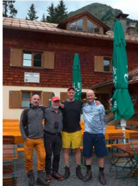
Vor der Konstanzer Hütte