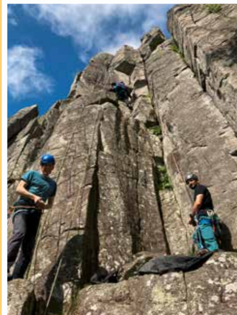
Topropes aufbauen, abbauen, fädeln, abseilen in allen Variation