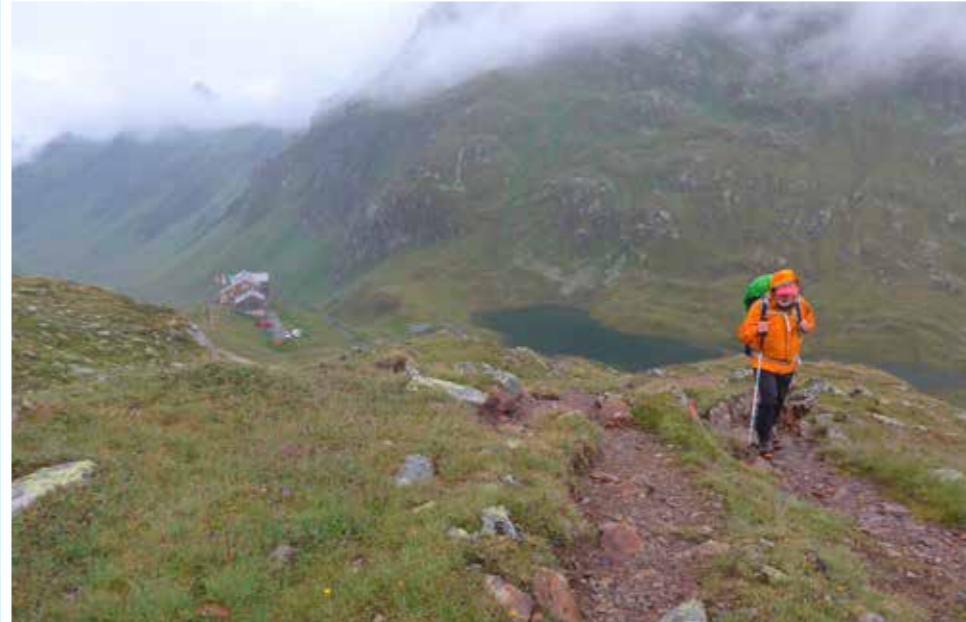
Über der Neuen Heilbronner Hütte