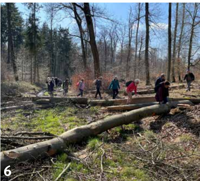
Bei bestem Wetter über Stock und Stein und offene Felder rund um die Ronneburg

Im Februar zog es die Wandernden in den Vorderspessart. Milde Temperaturen, Wind und leider keine Sonne sorgten trotzdem für sich stetig verändernde und schöne Weitblicke.