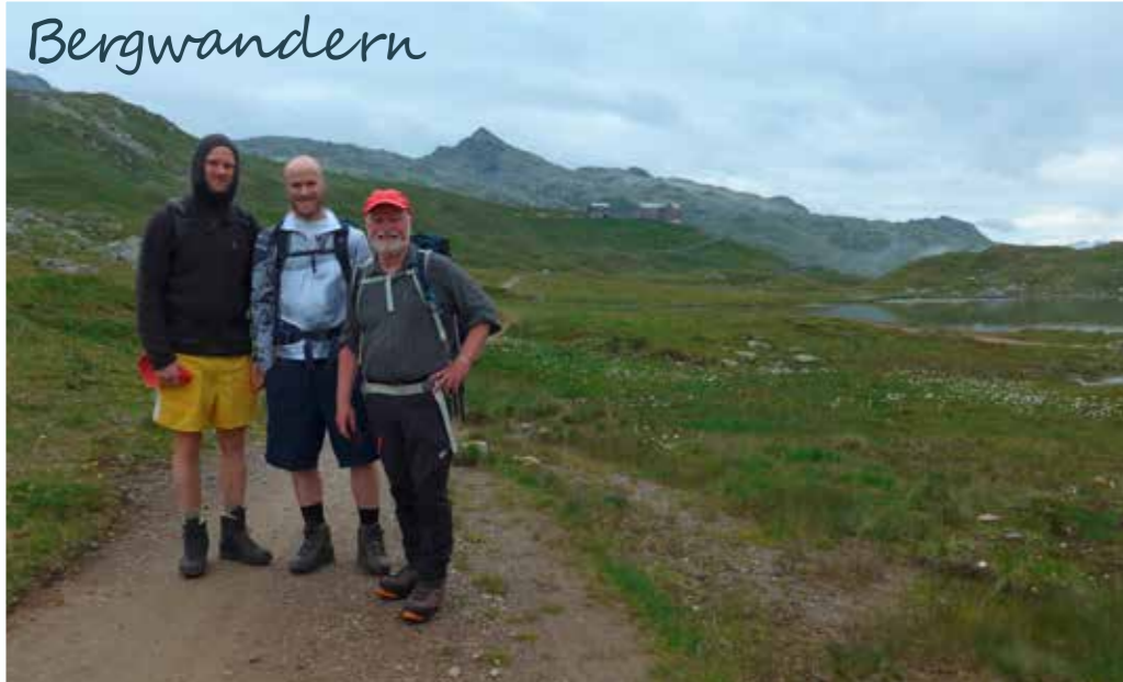
Aufstieg zur Neuen Heilbronner Hütte