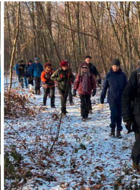
Trotz Kälte und Schneeresten motivierter Start ins neue Jahr Mit großer Gruppe von Offenbach nach Dreieichenhain