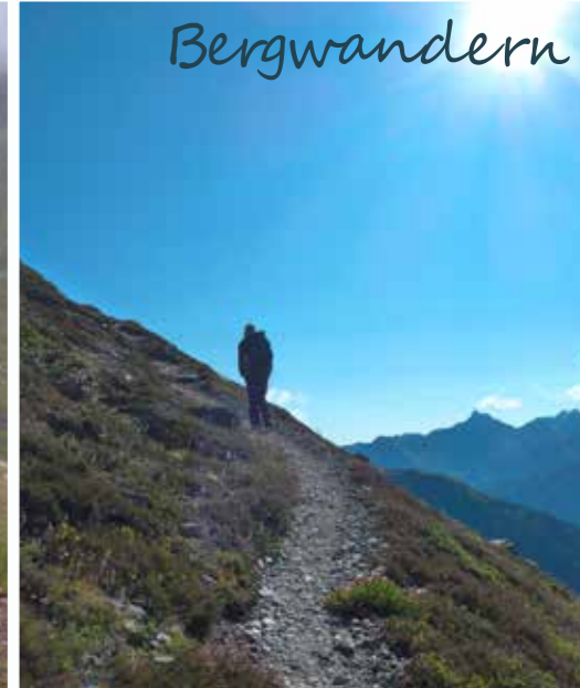
Hinauf zum Muttenjoch