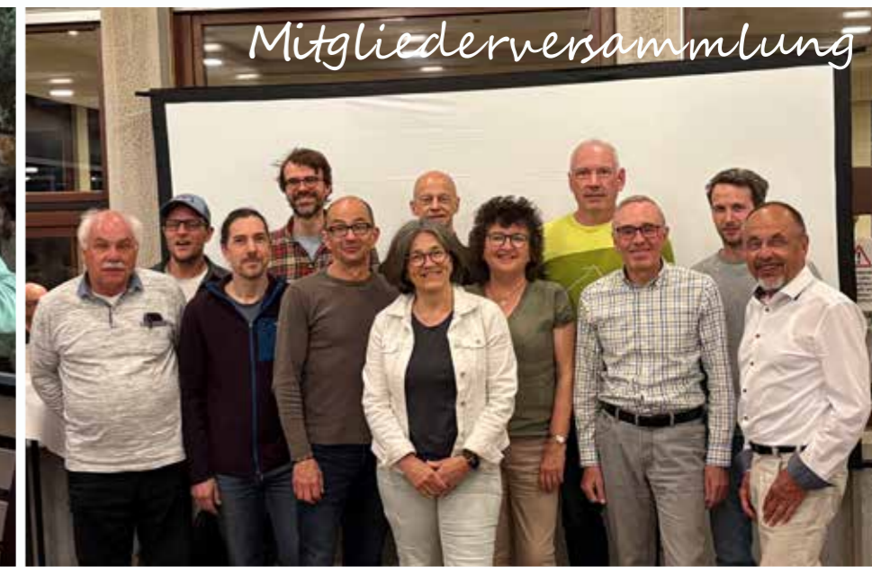
Der für die nächsten drei Jahre gewählte Vorstand