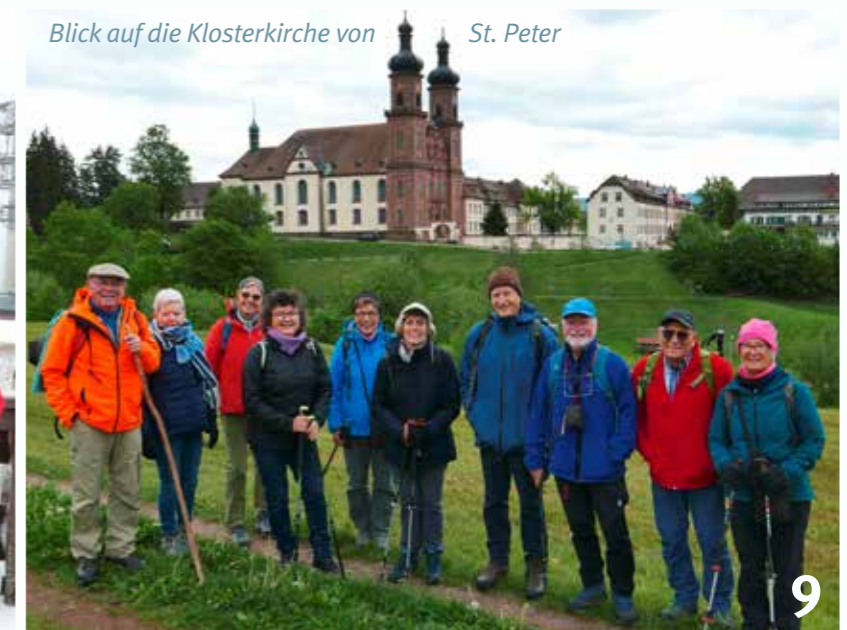
Blick auf die Klosterkirche von St. Peter